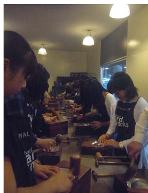
マレーシア研修にて コンピューター作り体験