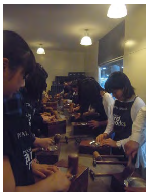
マレーシア研修にて コンピューター作り体験