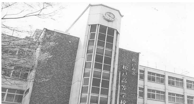
〔市立松戸高等学校の概況〕

1年生から3年生までのキャリア教育が充実しており、卒業後の進路については、概ね4年制大学、短期大学、専門学校、就職等です。なお、大学等への進学率は約80.5%(平成23年度卒業生)に達しており、今後さらに進路指導の充実を図ります。