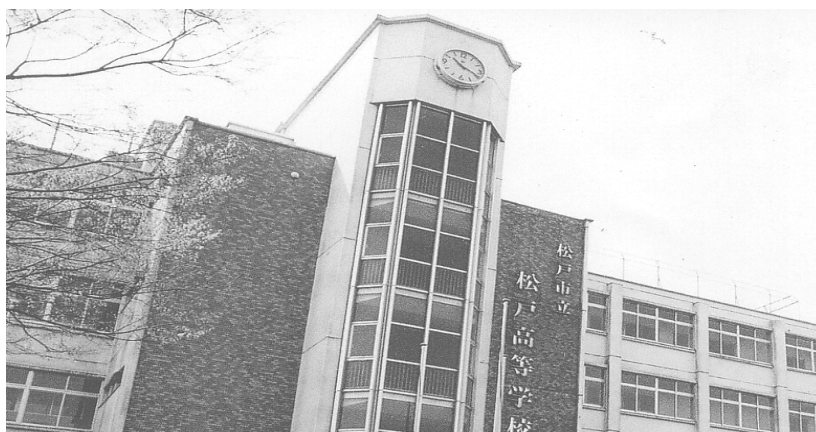
〔市立松戸高等学校の概況〕

1年生から3年生までのキャリア教育が充実しており、卒業後の進路については、概ね4年制大学、短期大学、専門学校、就職等です。なお、大学等への進学率は約84%（平成22年度卒業生）に達しており、今後さらに進路指導の充実を図ります。