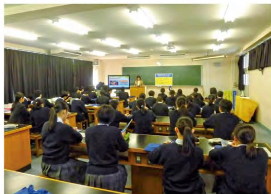
学校向け消費者教室の様子

学校の授業において、契約の基本やインターネット・SNSの トラブル事例を、ロールプレイングなど参加型形式を取り入 れながらわかりやすくお話しします。(開催時間 授業時間)