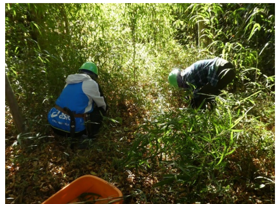
実地体験の様子 (里山保全活動での草刈り)