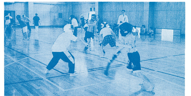
(スポーツチャンバラに励む子供たち)