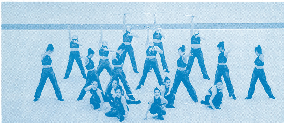
(1位に輝いた聖徳メジャーレットチームの演技)

昨年の八月十一日神奈川県川崎市で行われた「ドリルチーム日本大会」で、松戸市の聖徳大学附属高バトン部がメジャーレット部門(バトントワリング)の技術、チーム全体の正確さ、美しさを競う)でみごと一位となりました。また、ミリタリ部門(鋭敏で正確な動き、機械的なフォーメーション、整列を競う)でも、三位となりました。聖徳メジャーレットチームは、正確でリズムののった躍動感あふれる演技で観衆を魅了しました。