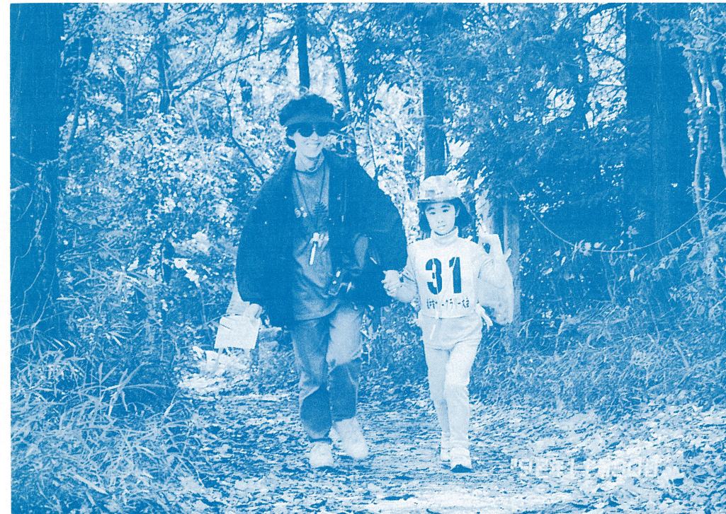
(「ゆっくり歩こう八柱からコース」を歩く親子連れ)

11月30日(日)健康で明るい県民づくり運動の一環として、「第1回松戸市ウォークラリー大会」が松戸運動公園をゴールとした5つのコースで、盛大に開催されました。