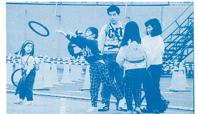
(ゴール後、軽スポーツコーナーで遊ぶ参加者)