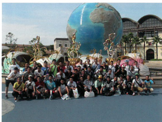
親善試合や交流を通じ、 親睦を深めた両国の選手たち

試合後は、森のホール21にて歓迎レセプションが行なわれました。両国選手団からの演出等もあり、会場は大いに盛り上がりました。その翌日、選手たちは東京ディズニーシーへの観光や、松戸市制施行七十周年記念の花火大会を観賞し、互いに親睦を深めました。