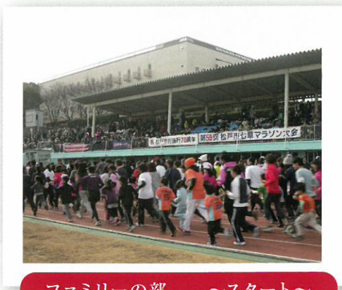
ファミリィーの部 ～スタート～

また、入賞者(1位～8位、 小中学生は10位まで)への 表彰や記念品の贈呈の他にも、 「7・59・70位」の方に、 記念品として松戸の銘菓を贈呈 しました。