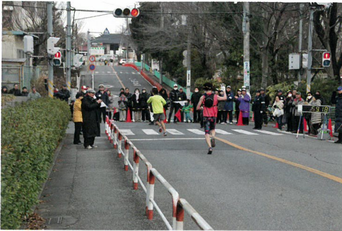
～ランナーに声援を送る市民の方々～

各給水地点には、アミノバリュー・水の2種類を準備しました。また、コース沿道にあるご自宅前で、チョコレートやあんぱんなどの配布をして頂いたボランティアの姿もありました。