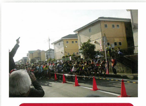
ハーフマラソンの部 ～スタート～

今大会、ハーフマラソンの部 は3,500名、5キロの部は 1,000名の定員を設け、申 し込み先着順という形をとりま したが、締切間際で定員に達し ました。 たくさんのお申し込み、誠に ありがとうございました。