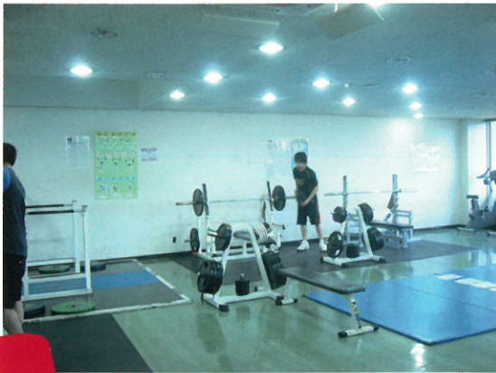
開かれた空間となった トレーニング室