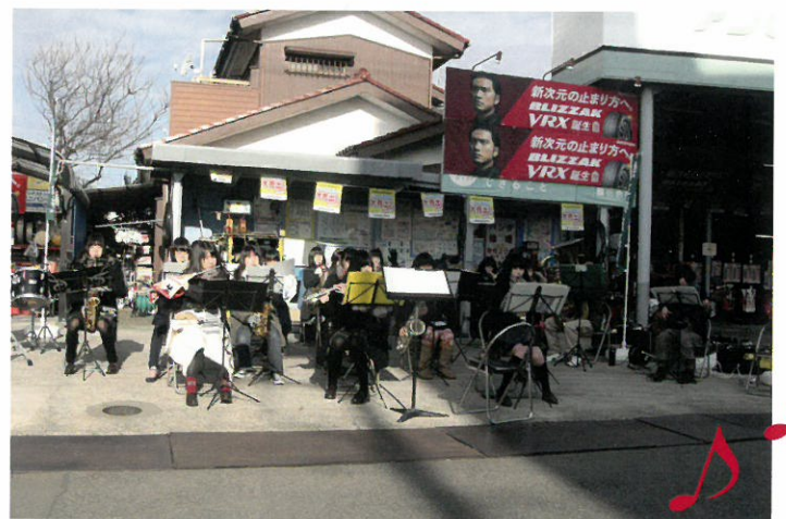
県立松戸高校吹奏楽部による演奏♪

当日、松戸運動公園内の会場には、松戸青年会議所による無料のみそ汁の振る舞いや、その他地元の松戸市商店会による飲食店やスポーツ用品の販売など、全十二の出店があり、完走したランナーや観客者で、大いに賑わいました。