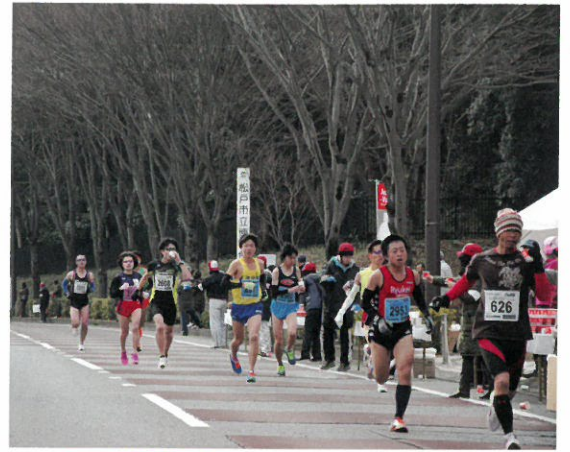
～給水所付近のランナー～