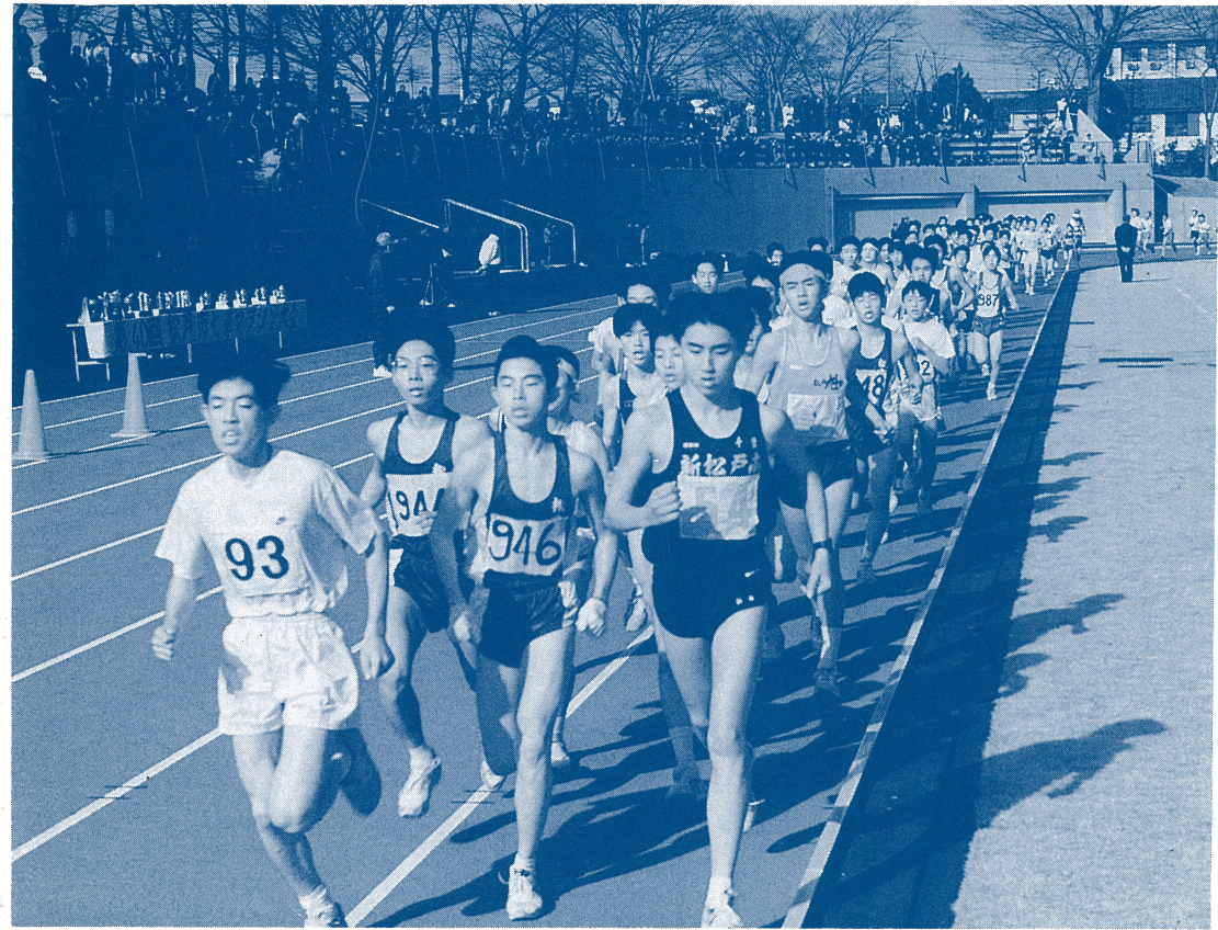
＜伝統の第40回七草マラソン大会＞ 中学男子スタート

古代ギリシャの公共広場のことです。この紙面が皆さんの情報の広場となることを願って名づけました。