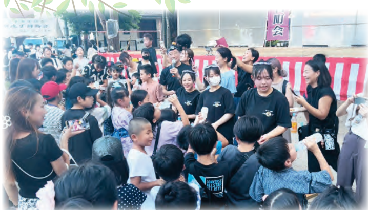
第44回 九丁目町会夏まつりの風景