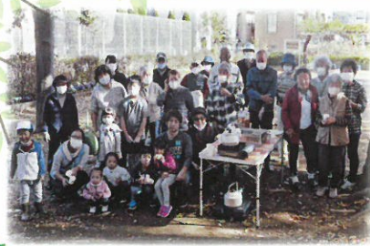
上矢切第一町会の皆様です！