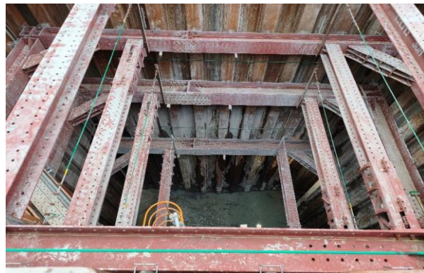
TNo. 2-2 推進工（推進機到達前）