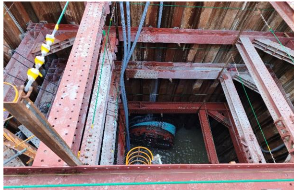
TNo. 2-2 推進工（推進機到達）