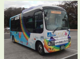
R5. 7 現在