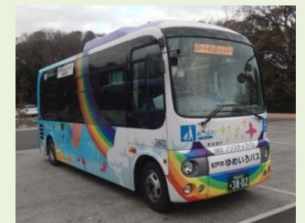
R5. 7 現在