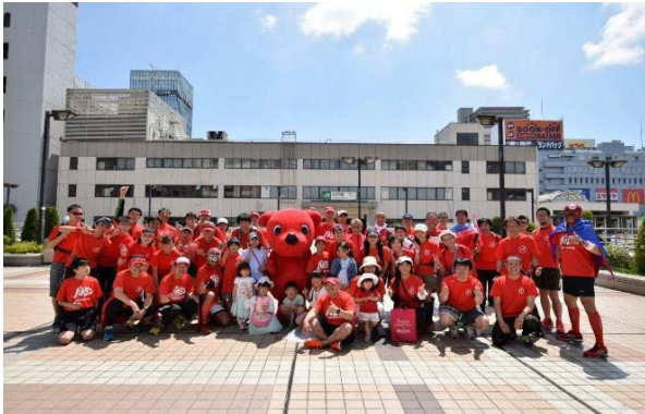
松戸駅前における集合写真