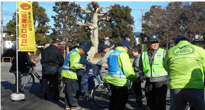
「犯罪ゼロの日」キャンペーン