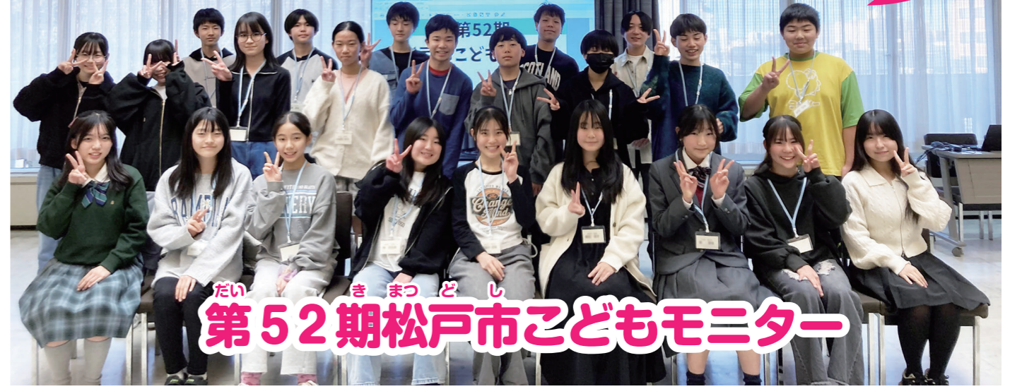
第52期松戸市こどもモニター

私たちは、市役所の方とグループワークを行い、こどもや子育てに関する取り組みについて説明を受けました。その中で自分たちが興味を持った「松戸市の取り組み」について、どうしたらもっと多くの人に取り組みを知ってもらえるか、みんなに制度を活用してもらえるか、みんなで意見を出し合いました!!