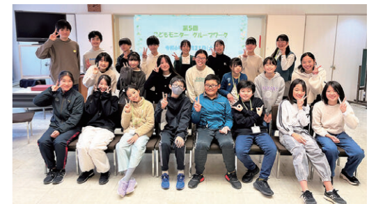
第51期松戸市こどもモニター

第51期の先輩モニターは、第3期松戸市子ども総合計画をみんなが読みたいための意見を出し合いました。「松戸市子ども総合計画」は松戸市に住むすべてのこどもや子育てをする人が幸せに暮らすための取り組みをまとめたものです。やさしい色やイラストを使って冊子を作りました。さらに、マンガで読める「こども版」も作ったのでぜひ見てください!