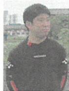
担当者：石井 匠 (松戸市子ども部 子どもわかもの課)

松戸市子どもわかもの課 地域の子どもが気軽に足を運び、安全安心に遊べる場にしていきます。また、子どもだけでなく、大人の方も、子どもから大人まで楽しく関わりあえる「交流の場」を目指します。