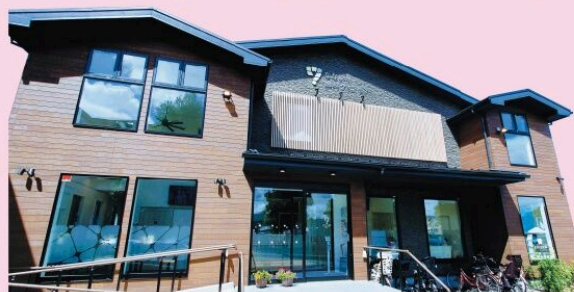
駐車場 5 台・第 2 駐車場 16 台・駐輪場もあります