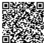
施設等利用給付認定の変更手続き (変更申請書 兼 変更届)