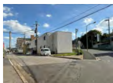
野菊野こども園新館

内容:広い人工芝の園庭で遊ぼう!シャボン玉あそびもしましょう。雨天の場合はフロアで遊べます。