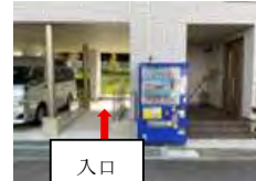
ベビーカー置き場

★【保健師講座】 23日(火)10:00～11:00 (受付9:45～)申し込みは6月17日(水)12時迄