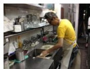
働いているメンバーさん