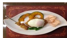
スパイシーなナシゴレン