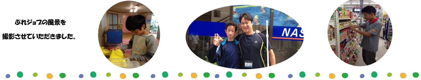
ぶれジョブの風景を

働く事を希望する児童 3 名、企業（特別養護老人ホーム緑風園さん、デイリーヤマザキ松戸本町店さん、スポーツクラブ NAS 松戸さん）、ボランティアの方々の協力で、6 月から 9 月の 3 か月にわたって、週末に一日一時間程度、職業体験を行い、毎月最終金曜日の定例会にて活動報告をします。まだ取り組み始めたばかりですので課題も多くありますが、年 2 回実施を目標に、少しずつこの活動を広めていきたいと思っております。