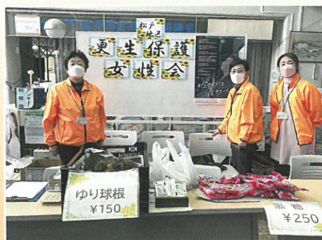
矢切地区ふれあい広場