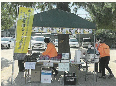
小金地区ふれあい広場