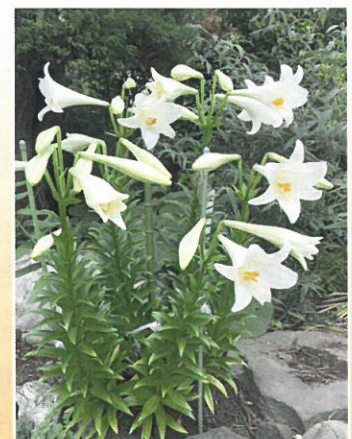
一つの株からこんなに花が咲きました。