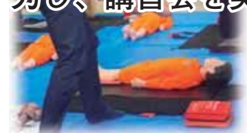
◀ 幼児救急法スクールでの実演の様子

救命・健康・安全意識に関する講習を実施しています。松戸市地区でも赤十字奉仕団と協力し、講習会を実施しました。