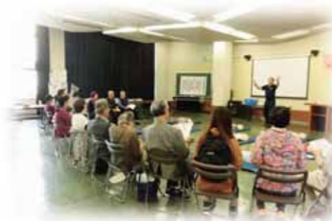
▲ 防災グッズの使い方や、防災についての講演会も実施しています！