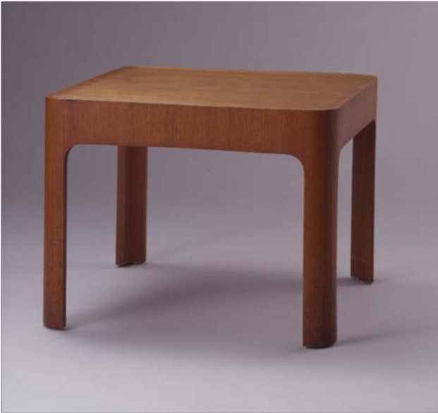
《テーブル OM2016》 1967 年