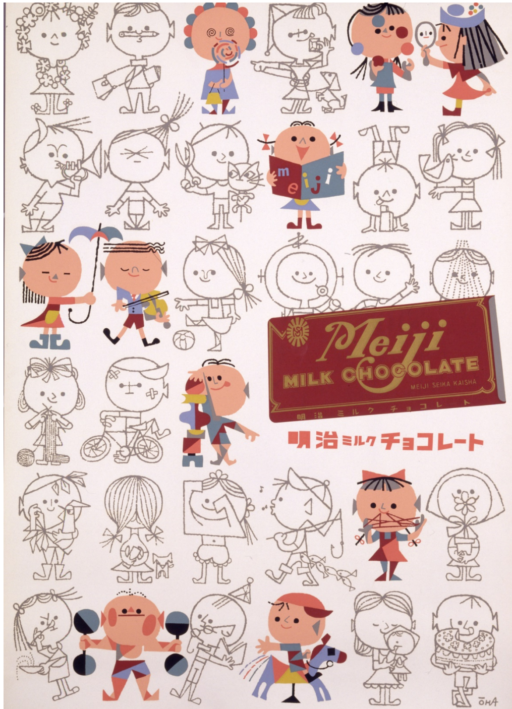
《明治ミルクチョコレート》1956年