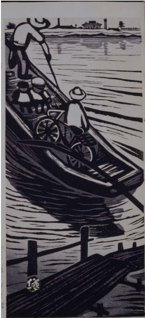
《矢切れの渡し》 1955～1958 年頃