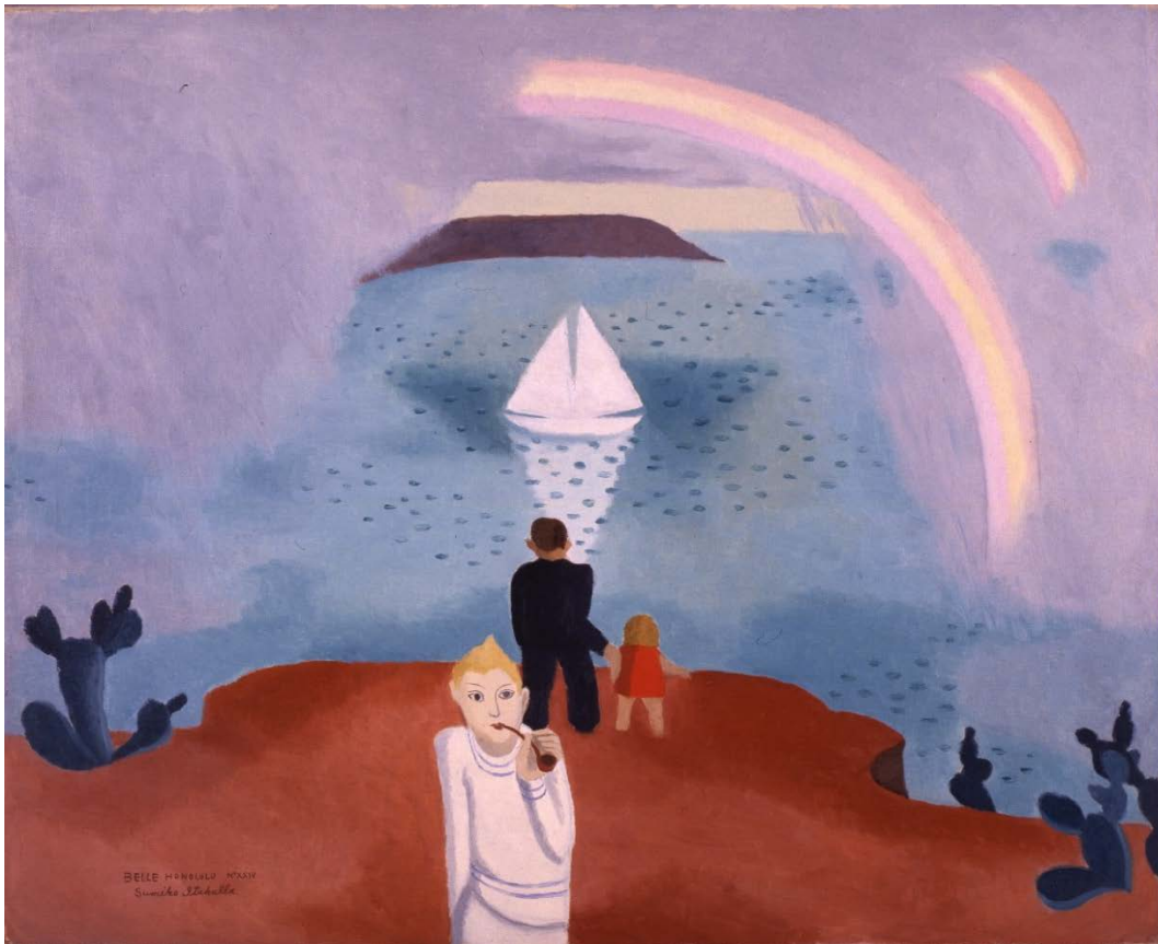
《ベル・ホノルル 24》1928 年頃