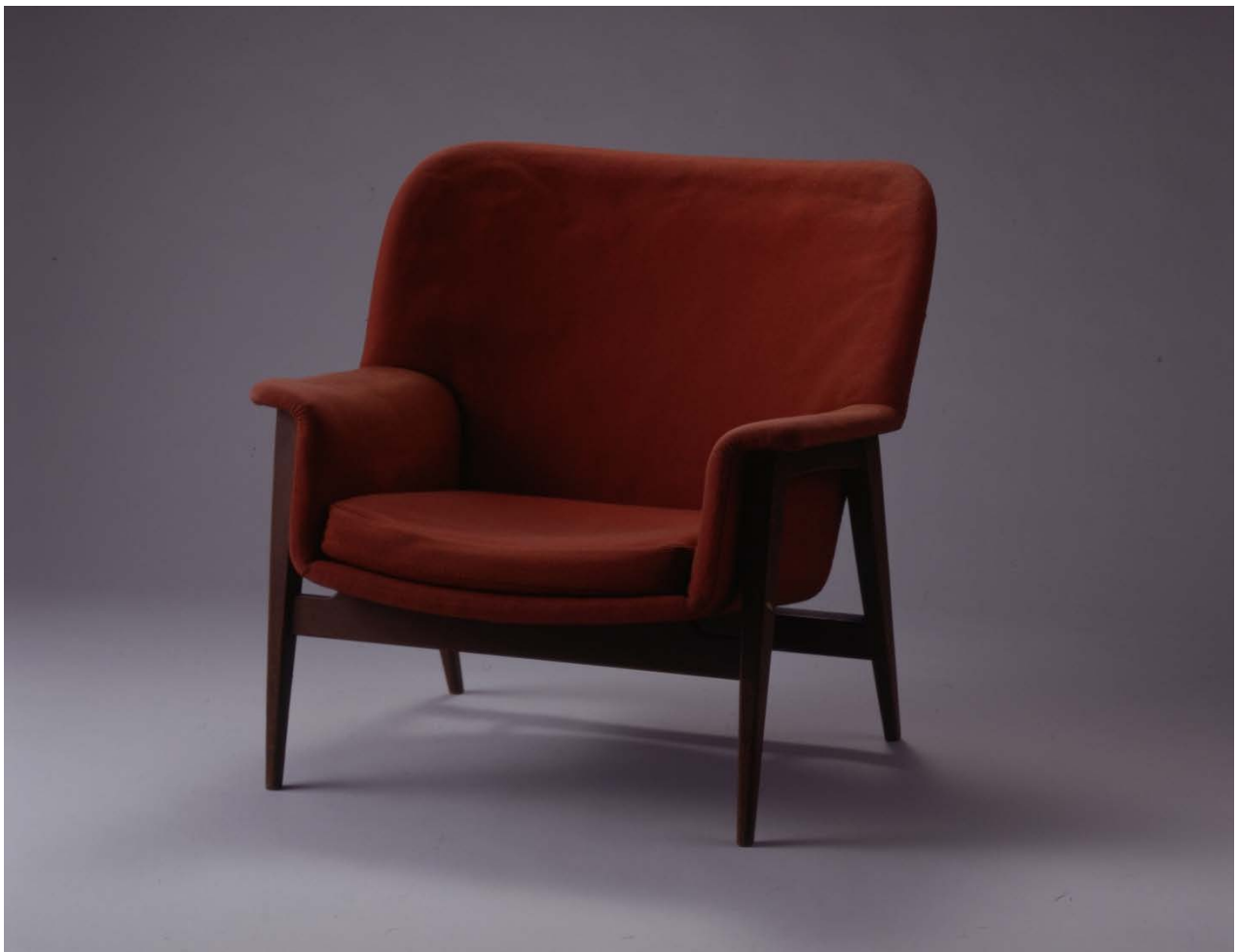
《イージーチェア 5005》 1958年