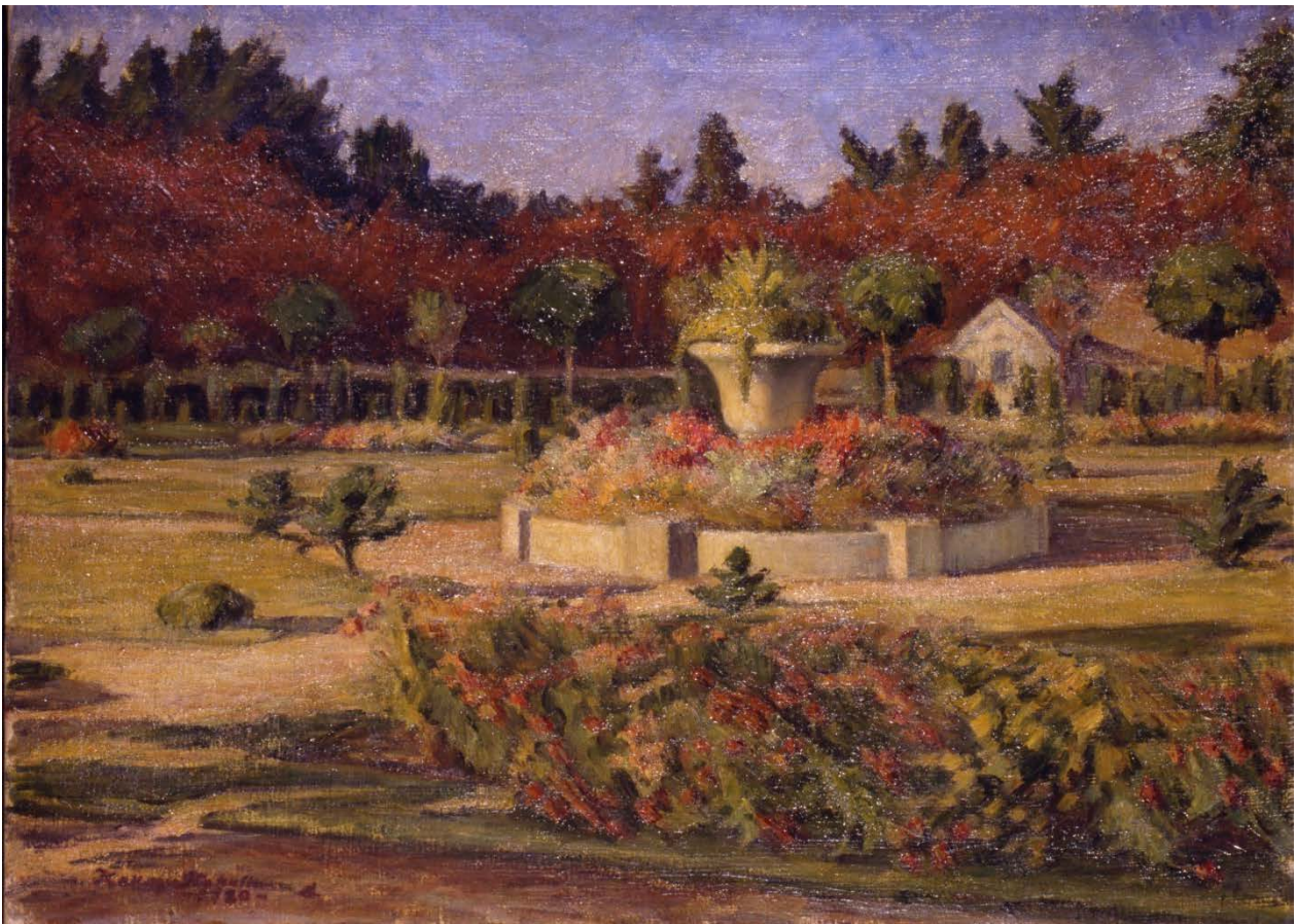
《風景 秋更け行く》1920 年