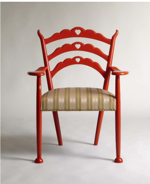
《朱の食堂肘掛椅子》1925年（2008年復原）