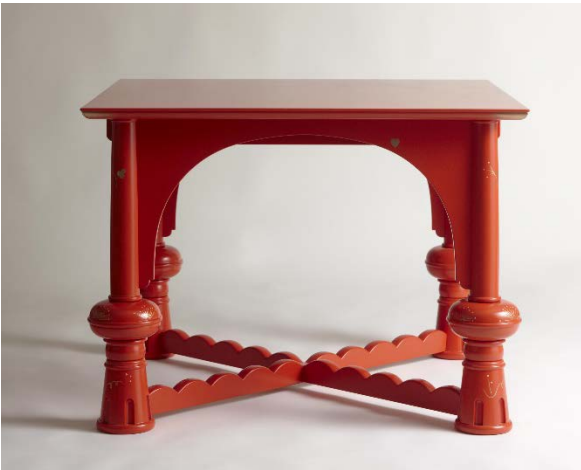
《朱の食堂食卓子》1925年（2008年復原）