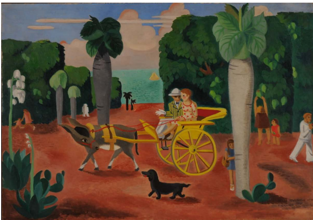
《ベル・ホノルル 12》1927～28 年頃