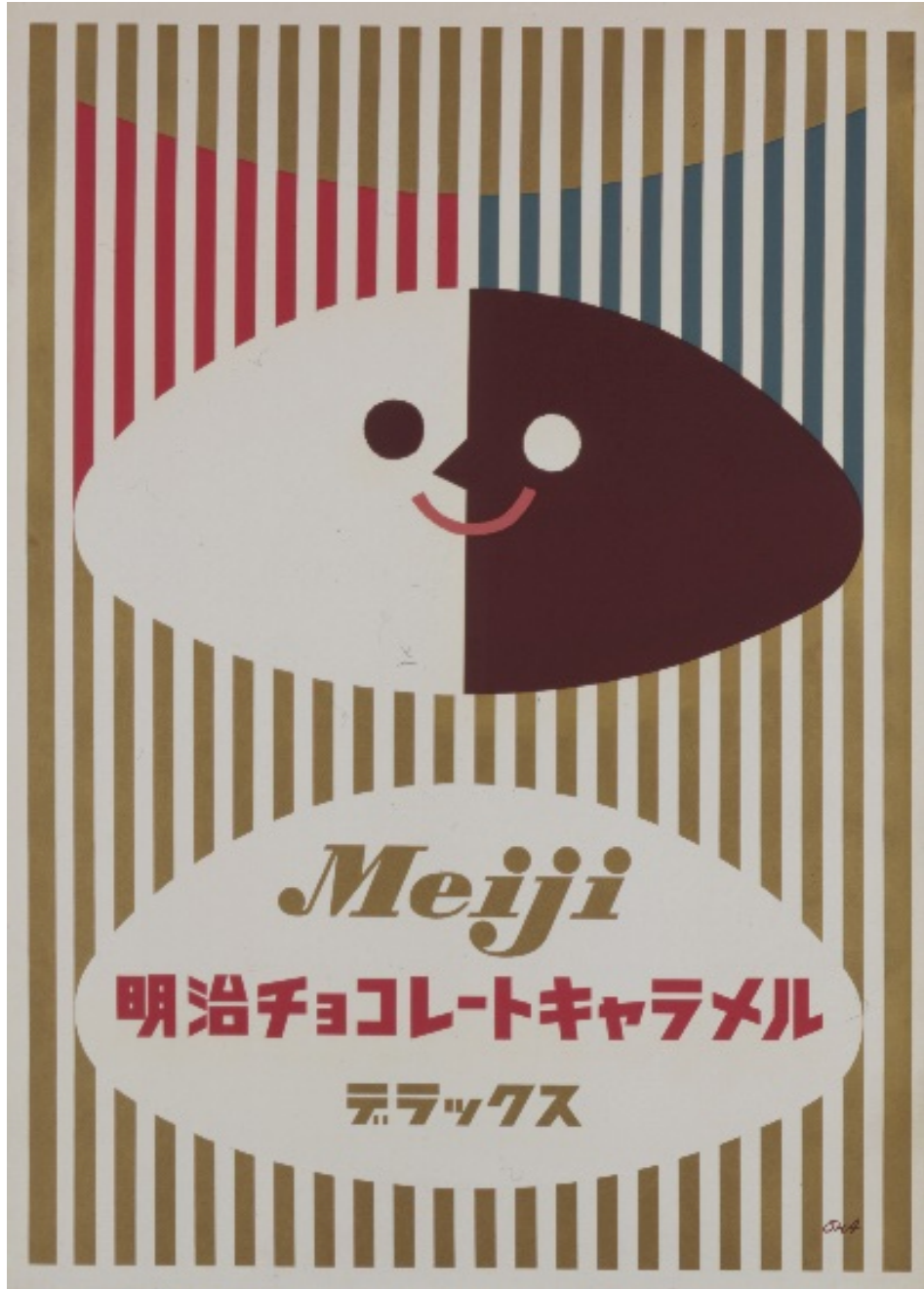
《明治ミルクチョコレートキャラメルデラックス》1957年