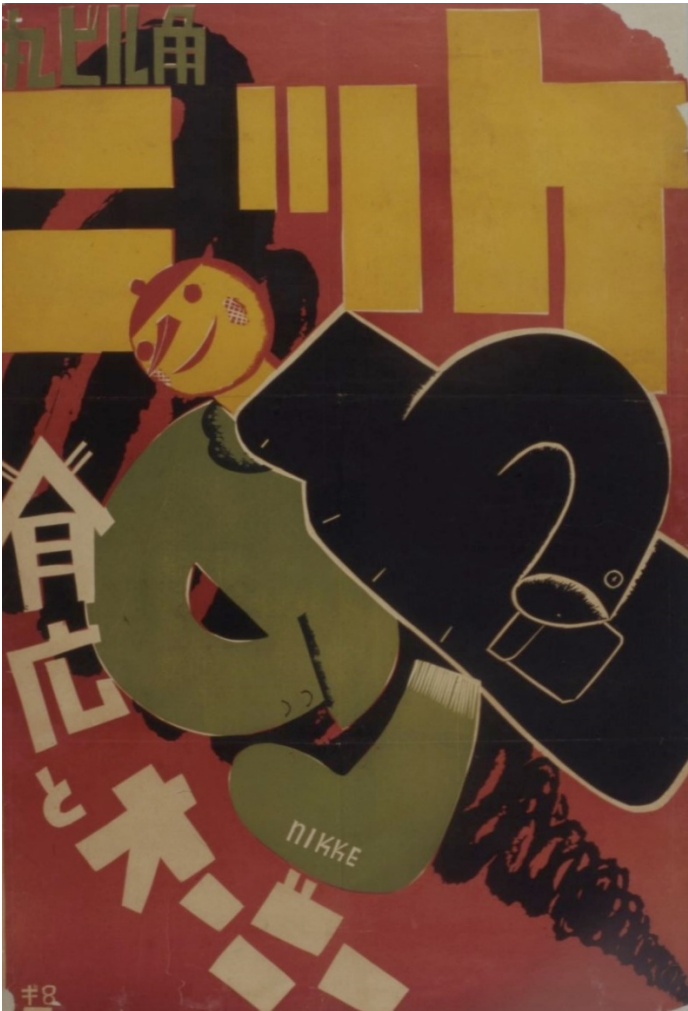
《ニッケ背広とオーバー》