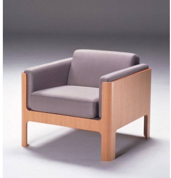
《安楽椅子 OM5048》 1967 年