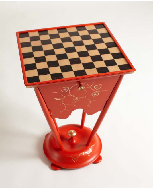
《朱の食堂茶卓子》1925年（2008年復原）