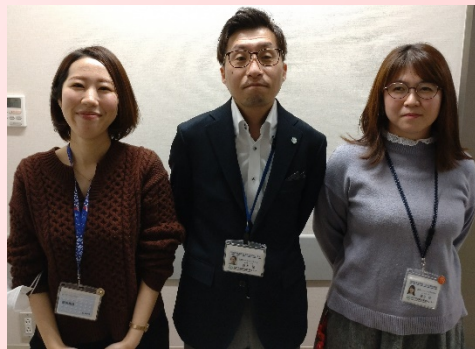
相談支援センター、がん診療対策室