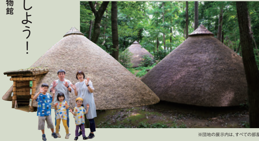
※団地の展示内は、すべての部屋に入れるわけではありません。特別な許可をいただいた上で撮影しています。