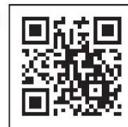
新冠疫苗接种 导航网二维码