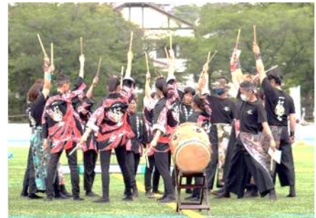
小金原 9 丁目太鼓