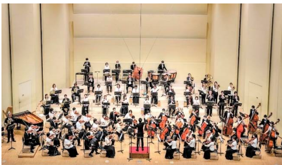
松戸市交响管弦乐队