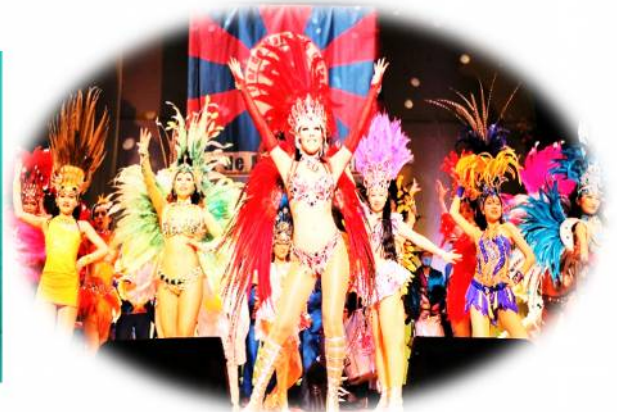
Flor de Matsudo Sereja

*外围三团体: (一社)松戸市观光协会、(公财)松戸市文化振兴财团、(公财)松戸市国际交流协会