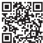
Máy tính/ Điện thoại thông minh

Điện thoại gập ※ https://m.sugumail.com/m/matsudo/home ※ Loại máy không hỗ trợ SHA-2 thì không thao tác được trên màn hình.