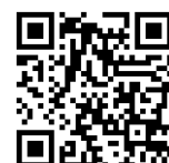
Mirai Bunko HP