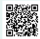
Matsudo City International Portal

ほん ないよう よこく へんこう ばあい 本ガイドブックの内容は予告なく変更される場合があります。