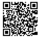
Matsudo City International Portal

https://www.city.matsudo.chiba.jp/InternationalPortal