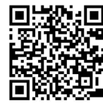
Matsudo City International Portal

https://www.city.matsudo.chiba.jp/InternationalPortal