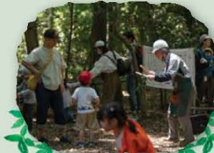
森の中は大きな遊び場！「楽しい」がいっぱい！！