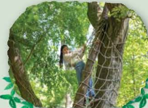
やっぱり 木の上からの景色はどうかな！