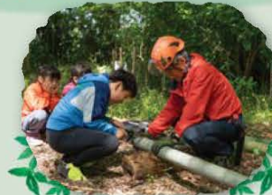
何ができるかな？ノコギリ初挑戦！

「オープンフォレスト」は、 里やまボランティア活動が行われている民有地の森を、森の所有者の協力を得て市民に公開するイベントです。 普段は入ることができない松戸の「小さな森」、18か所を公開！若葉と木漏れ日が美しい5月の森に足を運んでみませんか？ 都市に残された貴重な森を未来の子ども達に引き継ぐために、何が出来るかを考えるきっかけになることを願って毎年開催しています。