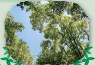
空を見上げると、木の葉がゆらゆら～(癒し)