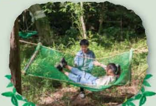
ハンモック楽しいよね！大人も乗れます！