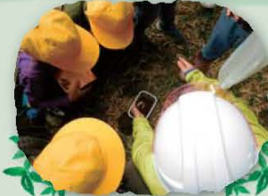
何かをハッケン！虫かな...？