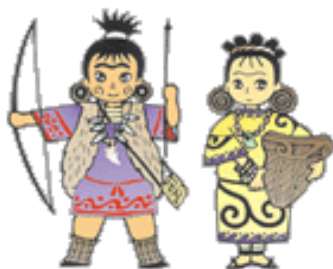
博物館マスコットキャラクター「じょうくん」と「もんちゃん」

公園中央口の側に建つ、「見て・触れて・体全体で感じる」を基本コンセプトにした、感動体験型の博物館です。建物の中には旧石器・縄文時代から団地の誕生まで、松戸三万年の歴史の息吹に触れる常設展示があります。その他にも特定のテーマに基づいて開催する特別展・企画展や各種体験教室、講座、講演、ハイビジョン映像の上映などが催されています。