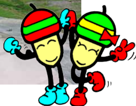
21世紀の森と広場シンボルキャラクター ドンちゃんグリちゃん