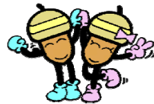
21世紀の森と広場シンボルキャラクター ドンちゃん・グリちゃん