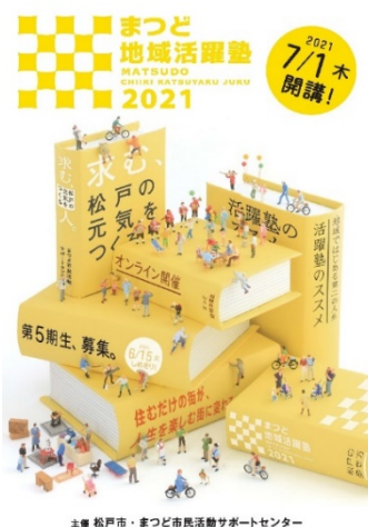
主催 松戸市・まつど市民活動サポートセンター

この塾に参加したことで、今まで住むだけだと思っていた街が、自分の街、人生を楽しむ街に変わったという人が増えています。この塾を通して地域で活躍する一歩を見つけませんか？