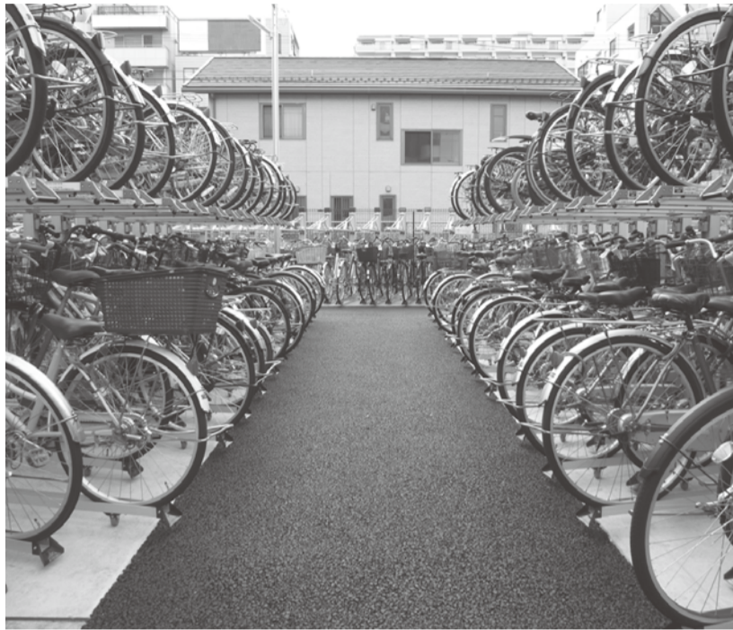
自転車は駐輪場に止めましょう(新松戸駅西口第8駐輪場)