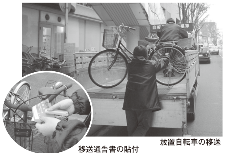
移送通告書の貼付

土・日曜日の駅前には、たくさんの人で混雑しています。そこに放置自転車があると、美観を損ねるだけでなく、通行の妨げになり大変危険です。そのため、市では土・日曜日も撤去活動を行っています。自転車は駐輪場へ駐車しましょう。