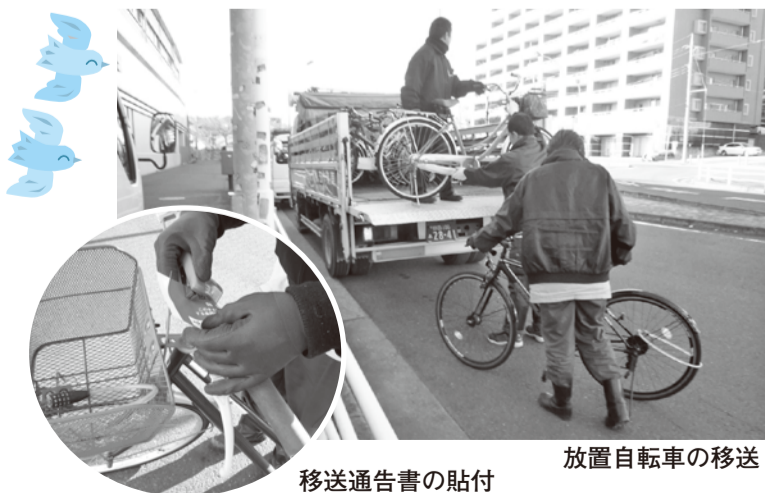
移送通告書の貼付

土・日曜日の駅前には、たくさんの人で混雑しています。ここに放置自転車があると、美観を損ねるだけでなく、通行の妨げになり大変危険です。そのため、市では土・日曜日にも撤去活動を行っています。自転車は駐輪場へ駐輪しましょう。