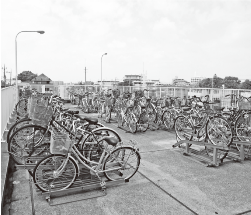
自転車は駐輪場に止めましょう(北小金駅南口第1駐輪場)