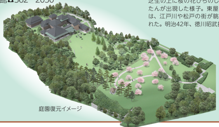
庭園復元イメージ