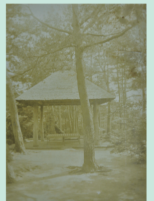
芝生の上に桜の花びらのじゅうたんが出現した様子。東屋からは、江戸川や松戸の街が眺められた。明治42年、徳川昭武撮影