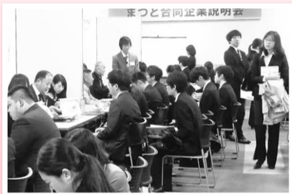
まつど合同企業説明会