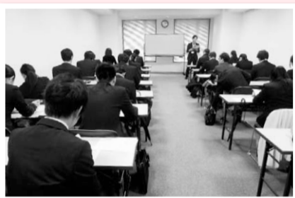
就職支援セミナー

※一時預かりあり(要申込、6カ月~就学前、先着10人、無料)。 希望する人は1月22日(月)までに電話で商工振興課☎711-6377へ。