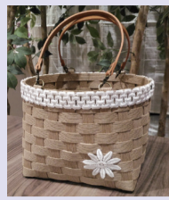
作品例: ランチバッグ

☎10月25日(水) [必着] までに、往復はがきに希望教室名・住所・参加者氏名(ふりがな)・電話番号を記入して、〒271-8588松戸市役所 消費生活課 秋の消費者教室係へ ※はがき1枚につき1人のみ(複数教室可) 申し込みできます。 ※②③④は、一時保育あり(要予約、各先着6人、1歳6カ月~小学2年生、おやつ代200円)。 ※定員に満たない場合は、11月1日(水)から電話で受け付け。