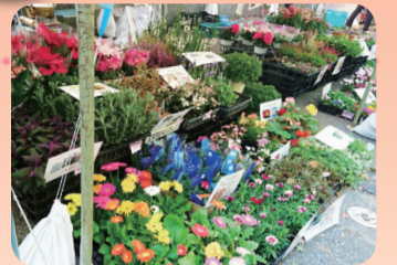
昨年の販売の様子

11月3日(祝)～5日(日)各9時～16時30分 会場 同学部松戸キャンパス 内容 模擬店、スタンプリリー、野菜・果樹の販売(4日(土)のみ)、コンサート他 ※詳細は戸定祭ホームページで。 ☎同学部 ☎308-8706