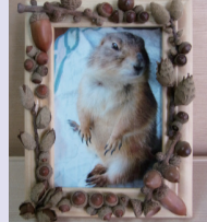
作品例: フォトフレーム