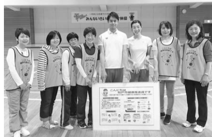
ピンクのピブスを着て活動しています

町会長・自治会長から推薦、市長から委嘱を受けて、地域で健康づくりの活動をしています