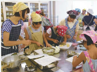
親子クッキング (馬橋北小学校家庭教育学級)