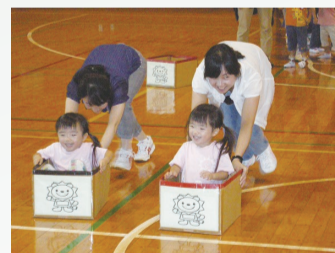
親子で力いっぱい体を動かします (幼児家庭教育学級)

「子どもとの向き合い方」と「自分の生き方を考える」ことを目的として、幼児家庭教育学級および中学校家庭教育学級を、毎年秋に開催しています。詳細は9月頃の広報まつどおよび市ホームページに掲載予定です。