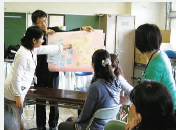
子育てについての悩みの共有 (金ケ作小学校家庭教育学級)