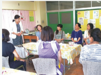
教頭先生を囲んでの講演会「子離れ・親離れ～思春期に思う～」 (旭町小学校家庭教育学級)