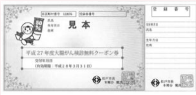
がん検診無料クーポン券