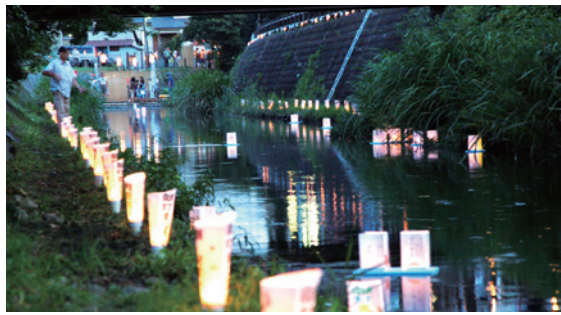
平成26年度松戸景観大賞 景観づくり活動部門 坂川とまちづくり市民の会

市では景観づくりを一層進めるため、景観条例を施行した平成23年から景観表彰を実施しています。