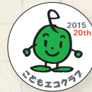
2015年度は20周年記念限定バッジです

活動の様子や感想などを報告すると、アーススタンプがもらえます。スタンプを5つ集めると、地球を守る「アースレンジャー」に認定される他、活動報告に対して、環境に詳しい先生からメッセージが届きます。