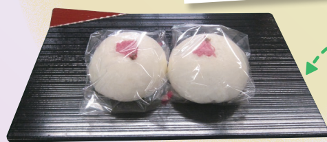
桜まんじゅう (さくら工房)