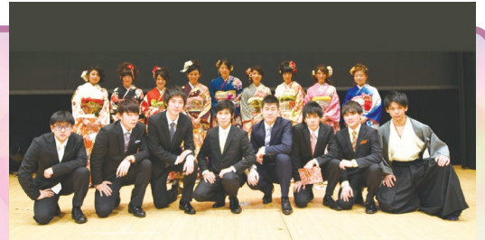
平成27年新成人スタッフの皆さん

募集対象平成7年4月2日~平成8年4月1日生まれの市民 ※謝礼や交通費等の支給はありません。 ※市のホームページでも募集しています。 団電話またはEメールで社会教育課社会教育班 ☎366-7462、✉mcsbakaikyoku@city.matsudo.chiba.jpへ