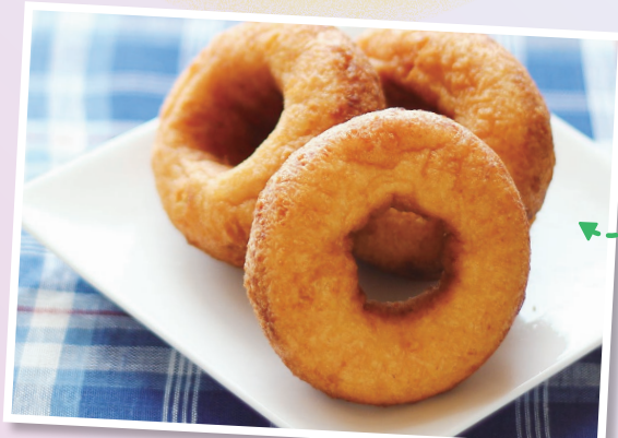
おからドーナツ (とうふ工房豆のちからで販売)