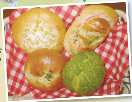
コーンパン・メロンパン等 (ジョイペーカーリーなごみで販売)