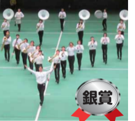
和名ヶ谷中学校吹奏楽部