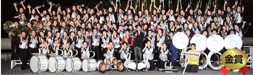
松戸六実高等学校吹奏楽部