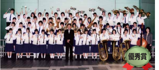
小金中学校吹奏楽部