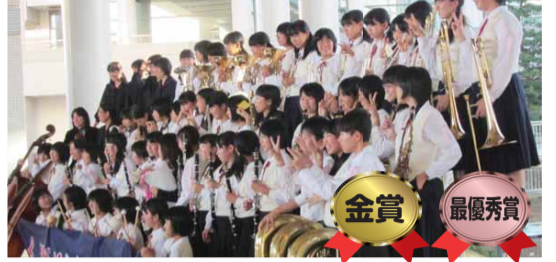
和名ヶ谷中学校吹奏楽部

10月31日に名古屋国際会議場で行われた全日本吹奏楽コンクールで和名ヶ谷中学校吹奏楽部が金賞に、11月4日に文京シビックホールで行われた日本管楽合奏コンテストで第一中学校・和名ヶ谷中学校吹奏楽部が最優秀賞、小金中学校吹奏楽部が優秀賞に、11月18日に大阪城ホールで行われた全日本マーチングコンテストの高校以上の部で松戸六実高等学校吹奏楽部が金賞に、中学の部で和名ヶ谷中学校吹奏楽部が銀賞に輝きました。