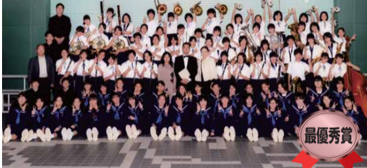
第一中学校吹奏楽部