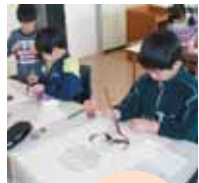
凧づくりと凧あげ体験