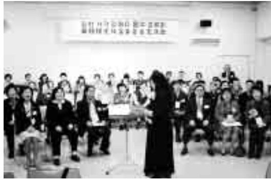
前二列が韓国視覚障害者連合会の皆さん、後列が松戸市のコーラスハーモニーの皆さん

10月26日、健康福祉会館(ふれあい22)で、日・韓視覚障害者音楽交流会が開催されました。松戸市と大邱(テグ)広域市は平成元年からスポーツ交流を続けていますが、視覚障害者の音楽交流会は今回が初めて。約松戸市障害者団体連絡協議会が実現させました。 来日したのは、韓国視覚障害者連合会の大邱広域支部から視覚障害者など約二十人。松戸市からはコーラスグループ「コーラスハーモニー」から約五十人が参加しました。