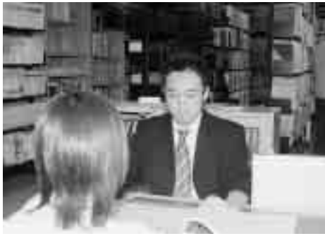
行政資料センターで請求を受け付けています

行政資料センター(市役所別館一階)では「公文書公開コーナー」を備え、公文書開示請求の受け付けや相談等を行っています。また、各種行政資料の閲覧や、一部の資料については有償頒布や貸し出しも行っていきますので、ご利用ください。