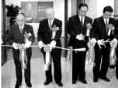
エジソン展初日にテープカット

年の瀬も迫り、何かと気ぜわしくなつてまいりましたが、この一年を振り返つて、私なりに松戸の十大ニュースを選んでみました。 千葉県知事選挙・同県議会議員補欠選挙(3月)と衆議院議員総選挙が行われ(9月) 衆議院議員総選挙は、関心が高く、高投票率でした。「安全で快適なまちづくり条例」が改正され、重点推進地区での違反者には直ちに過料が課せられることになりました(4月) またまた、違反者が見受けられます。市民の皆さんの更なるご協力をお願いいたします。 インターネットによる市議会本会議の録画放映が開始(6月) 天皇陛下が松戸新田にある建具製造メーカー「ハリマ産業株式会社」を視察されました(7月) 天皇陛下が本市を幸