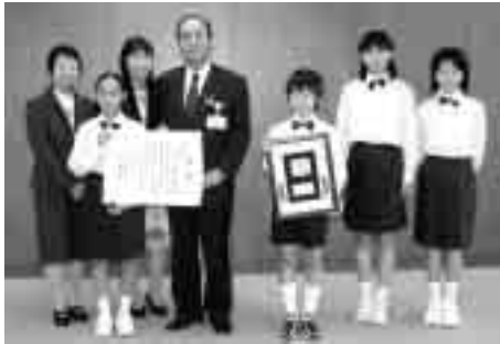
牧野原小の児童が、NHK全国学校音楽コンクールで受賞した報告に市役所を訪れました

銅賞を受賞しました。日頃の児童たちの練習の成果が、実を結んだものと思います。その栄誉を心から称えたいと思います。さて、先月の29日か