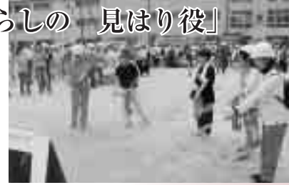
住民参加による消火訓練(矢切小学校で)

秋の火災予防運動が今年も全国一斉に行われます。市消防局では、「うっかり火災0運動」「放火されない・させない環境づくり」の2本柱で火災件数の減少を目指します。この機会にご自宅や職場の防火対策についてもう一度考えてみましょう。