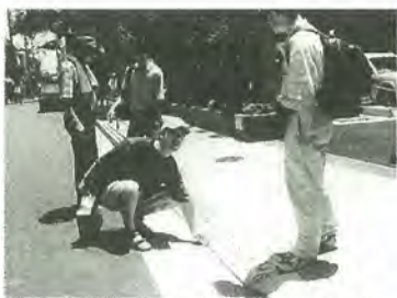
世田谷の工夫された緑石を見学する委員

3月から総台地区で、福祉のまち・市民プラン提言委員会が活動しています。この委員会は、公募で集まった10人の市民がボランティアにより、みずから事務局をつとめる自治方式で、1年をめぐり総台の福祉のまち・市民プランを作り、市に提言していただくものです。このたび、この委員会が活動を紹介したホームページを開設しました。ホームページには、7月20日に委員会へ訪問した世田谷のまちづくりの見学会の報告や、9月に行われるアンケート調査など委員会の活動が掲載されています。ぜひ、ご覧ください。 URL http://www58.tok2.com/home/minoridai/ ※市のホームページでも紹介しています。 ☎健康福祉本部企画管理室☎366-7350