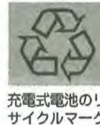
充電式電池のリサイクルマーク