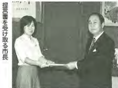
提言書を受け取る市長

9月以降、来庁された方の中には、お気づきの方もいらっしゃると思いますが、職員の方々の着ている名札を一回り大きなものとし、所属も分かるようにしました。これは、「庁内刷新プロジェクト」の提言を受け、実行する市役所刷新の第一