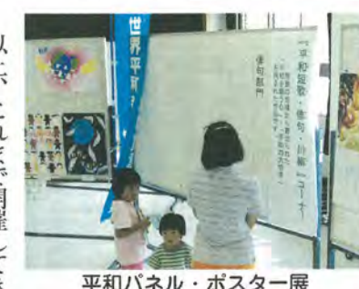
平和パネル・ポスター展

味わいました。 以上、これまで開催してき た主なイベントを紹介しまし たが、今後もいろいろな催し を企画し、開催していきます。 一人でも多くの市民の皆さん が、平和の尊さ・大切さを思 い参加されることをお待ちし ています。