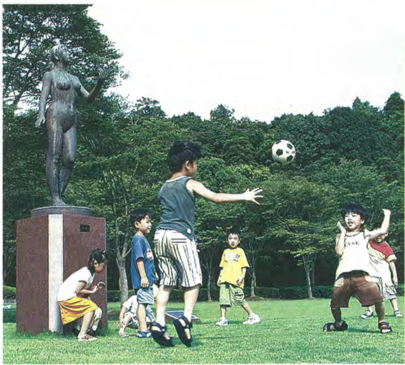
平和モニュメント「光風」の前で遊ぶ子どもたち（21世紀の森と広場）

我が国は、世界で唯一の被爆国である。 何人も平和を愛し、平和への努力を続け、常に平和に 暮らせるよう均しく希求しているところである。 しかし、現下の国際情勢は、緊張化の方向に進み市民 に不安感を与えている。 かかる状況に鑑み、松戸市は日本国憲法の基本理念で ある平和精神にのっとり、平和の維持に努め、併せて非 核三原則を遵守し、あらゆる核兵器の廃絶と世界の恒久 平和の達成を念願し、世界平和都市をここに宣言する。 昭和60年3月4日 松戸市