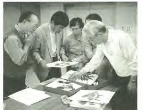
昨年の専攻科学習風景

期日…9月4日～11月27日の毎週水曜日 時間…午後1時30分～3時30分 対象…市内在住・在勤の60歳以上でまつど生涯学習大学を修了している人 定員…各コース30人(抽選) 費用…無料(教材費等実費) 围8月15日(木)までに、往復ハガキに①住所②氏名(フリガナ)③年齢④性別⑤電話番号⑥生涯学習大学修了年度⑦希望コース名⑧応募の動機⑨特技・趣味・返信用あて名を記入して、〒271-0094松戸市上矢切299の1松戸市総合福祉会館内 公民館まつど生涯学習大学専攻科係(☎368-1214)へ