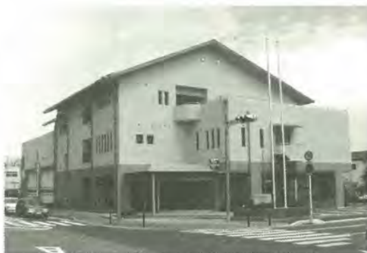
大規模災害対応機能を備えた五香消防署

危機管理能力の充実強化をテーマに、最新の耐震基準と非常用無線設備や備蓄倉庫等を備えた基幹消防署となります。 また、市民の皆さんから親しまれる消防署として防火指導や、応急手当指導などの施設も整え、さらに、バリアフリー設計も取り入れました。 今後、五香・常盤平地区等のランドマーク