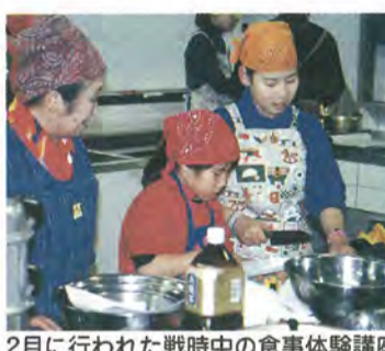
2月に行われた戦時中の食身体験講座

2月9日、市民会館で「戦 時中の食身体験講座」を開催 しました。 飽食の時代と言われる現代 において、戦中・戦後間もな い食糧難の時代の厳しさを実 体験してもらい、食事を通じ て平和の大切さをおかみしめて もらおうという目的で開催し ました。家族連れを含む四十 二人が参加し、昔ながらの麦 ごはんやさつまいも汁を作り、