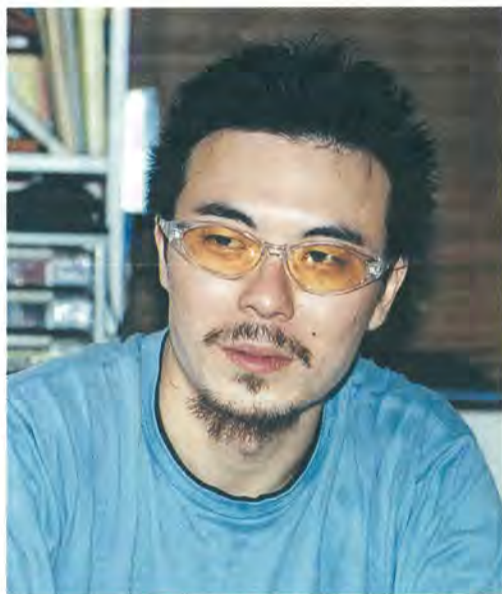
東京芸術大学美術学部漆芸研究室講師

学院漆芸専攻に進み、昨年から現在の研究室講師に就いた。木製品に塗り、磨くだけが漆芸ではなく、紙や布などのいろいろな素材を用い、漆を塗って自在な形に固め、表面には心地よい触感を持たせる。そんな造形的な作品も可能にしてくれるのが、漆の魅力という。