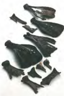
シカやイノシシの肩甲骨に点々と焼いた跡が残っています