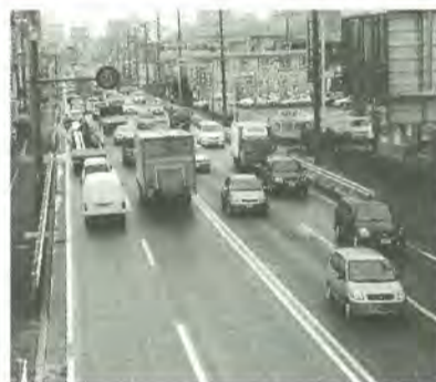
[平成13年度大気環境測定結果]

二酸化硫黄・一酸化炭素は環境基準を達成していますが、浮遊粒子状物質および二酸化窒素については、測定局により未達成でした。 光化学オキシダントについては、環境基準は未達成で、東葛地域の光化学スモッグ注意報発令は9日でしたが、健康被害発生は報告はありませんでした。 また、有害大気汚染物質について、トリクロロエチレン、テトラクロロエチレンは環境基準を達成していますが、ベンゼンは一部未達成でした。