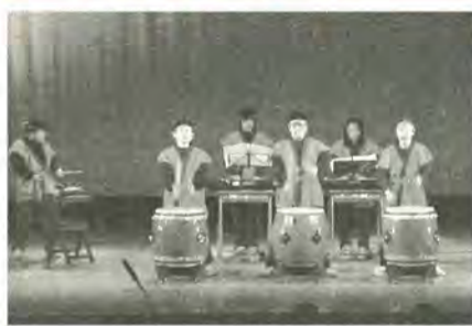
昨年の合同学芸発表会