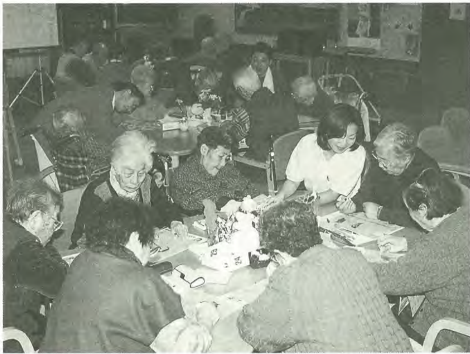
通所介護（デイサービス）を利用して楽しむ皆さん