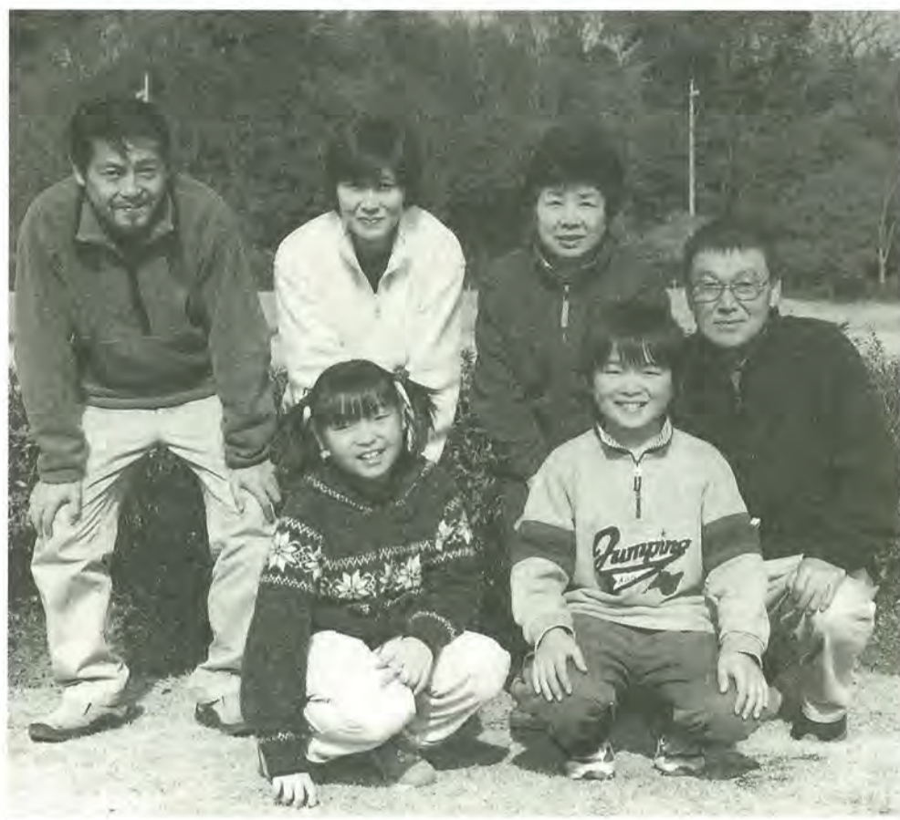
国民年金は 世代と世代の支え合い

妻がその老齢基礎年金の四分の三の額を六十歳から六十五歳の間、受けられます。死亡一時金・三年以上の保険料を納めた人が、年金を受けたいときは、生計を同じくしていた遺族に支給されます。