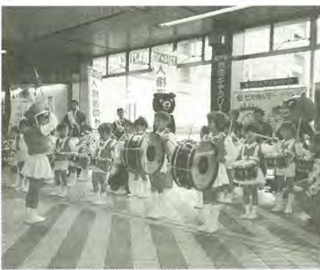
保育園児による演奏会および啓発活動

12月4日から10日までの1週間を「人権週間」として人権尊重の理念の普及を図っています。この機会に人権についてもう一度考え、皆さんがこれは人権問題ではないかと感じたことや困りごと、心配ごと、子どものいじめの問題での悩みごとなどがありましたら、人権擁護委員に遠慮なくご相談ください。相談は無料で、秘密は固く守られます。また、千葉地方法務局松戸支局(☎363-6278)でも相談を受け付けています。※定例の人権相談については、広報まつどの相談案内をご覧ください。