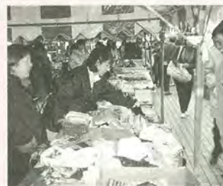
昨年の福祉バザー

内容手作り品（縫製品・木工品・陶芸品・菓子ほか）の販売、各福祉施設の紹介、バザー参加施設 ●わかば園・第2わかば園・小金わかば苑・松里福祉作業所・第2松里福祉作業所・市立のぞみ学園・もえぎ作業所・福祉作業所ひまわり・福祉作業所ゆりの木・アートボックス作業所・コスモス作業所・福祉作業所ふくし館ばれっと・いぶきの広場・第2いぶきの広場・喜楽家・福祉作業所だっくす・ピオラ工房・みのり作業所 ☎障害福祉課 ☎366-7348