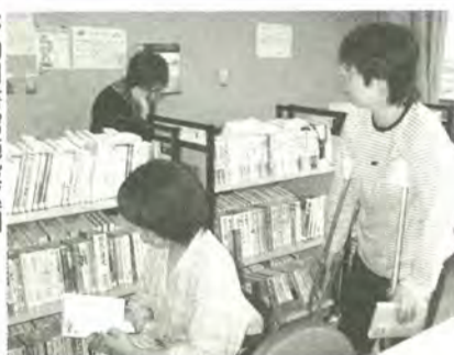
移動図書館施設巡回

職員が直接、本やCD等をご自宅にお届けします。 市内在住の身体障害者手帳（一級～三級）の交付を受けている人、または寝たきりの人が対象です。 ※この制度を利用するには、事前に登録が必要です。 ○施設巡回 移動図書館車により病院や老人ホーム等へ巡回し、図書の貸し出しを行っています。