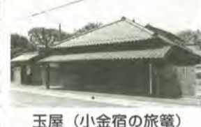
玉屋(小金宿の旅籠)

コース：市役所「虚無僧寺一月寺跡」玉屋(小金宿の旅籠)「小金宿本陣跡」東漸寺「本土寺参道」東平賀貝塚「小金北市民センター」(昼食)「本土寺」万満寺「市役所」