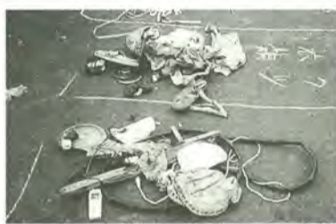
テーブル・靴・衣類などの異物が見られます。