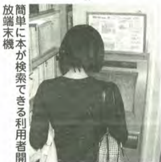
簡単に本が検索できる利用者開放端末機