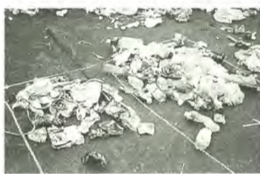
ピン・缶・紙・ペットボトルなどの異物が見られます。

「リサイクルするプラスチック」の異物の現状(プラスチックごみの捨てられ方)の現状(プラスチックごみの捨てられ方)の中には、まだ異物(左写真)が混入されています。