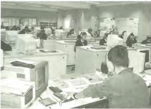
L1教室での授業風景

募集定員(予定)：全日制普通科第一学年 三百二十人(定員の四〇%以内は推薦)、国際人文科第一学年 四十人(定員の五〇%以内は推薦) 応募資格：市内在住で中学校卒業した人または3月卒業見込みの人(ただし国際人文科は市外からの応募も可)